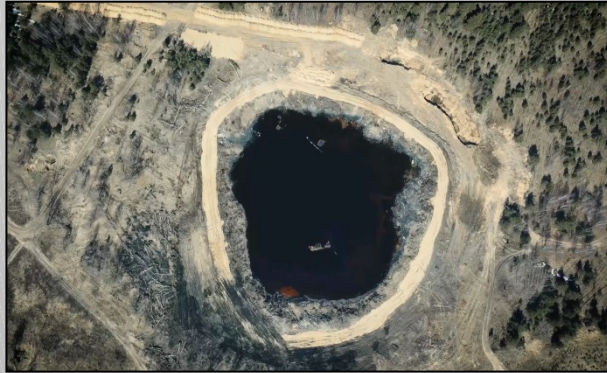
Ликвидация наиболее опасных объектов накопленного экологического вреда