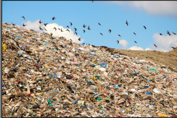
Ликвидация несанкционированных свалок до 2024