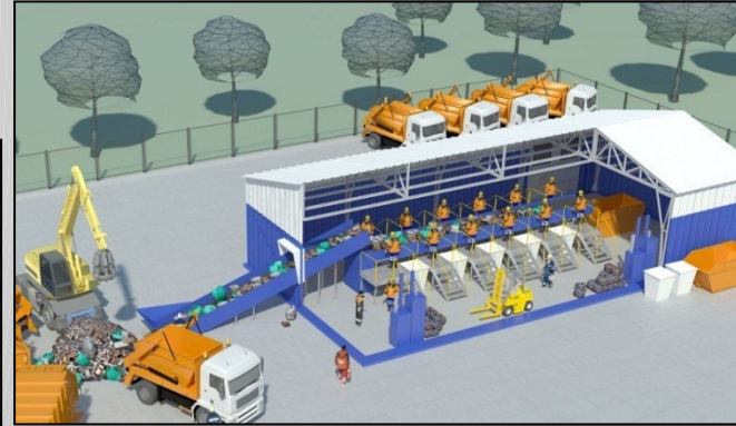
Введение в эксплуатацию производственно-технических комплексов по обработке, утилизации и обезвреживанию отходов I-II класса опасности