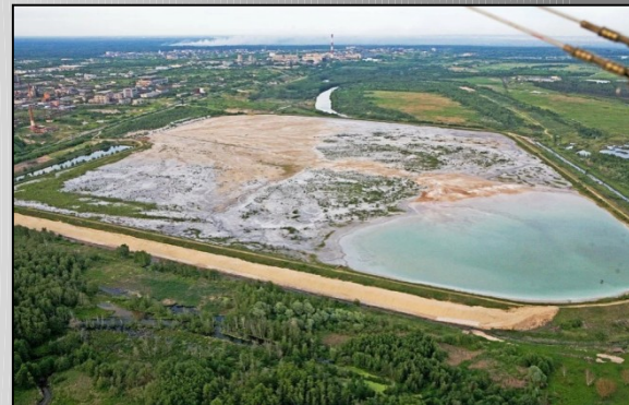
Шламонакопитель «Белое море»