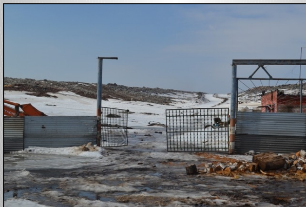
«Игумновская свалка ТБО»