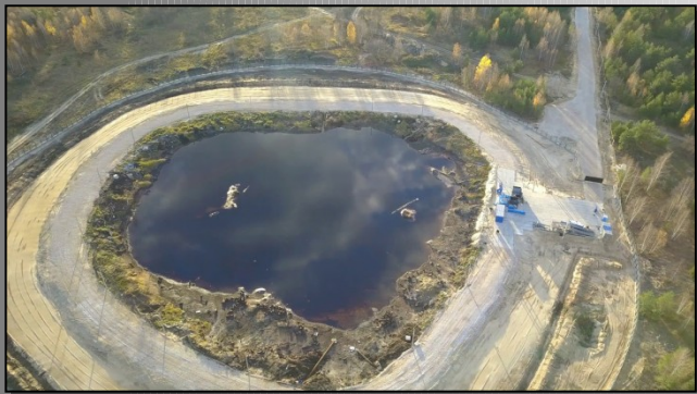
Шламонакопитель «Черная дыра»